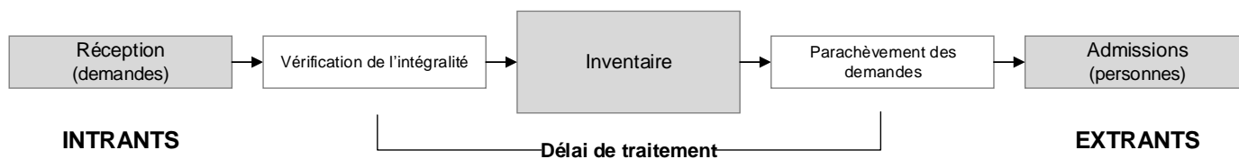
Image 1. Processus de réception des demandes et des admissions

La cible de demandes ( intrants ) est fixée à la discrétion du ministre, en tenant compte de la taille de l'inventaire, ainsi que du nombre de demandes nécessaires pour atteindre les cibles d'admissions ( extrants ). La cible de demandes est le pilier du système de gestion des demandes car le calibrage du nombre de demandes acceptées en traitement permet de gérer l'inventaire et les délais de traitement.