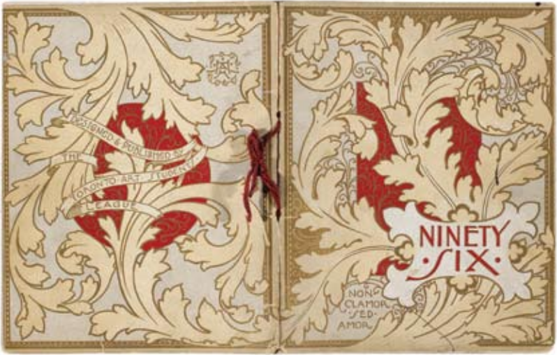
A.H. Howard, plats verso et recto du calendrier de 1896 [3]