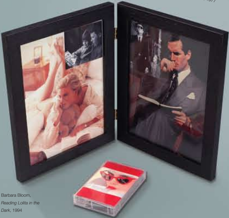
Barbara Bloom, Reading Lolita in the Dark , 1994

Les technologies et les phénomènes acoustiques ont ouvert un champ d'expérimentation artistique dès la fin du XIX e siècle, mais ce n'est que dans les années 1950 et 1960 que les arts visuels ont amorcé un « virage sonore » définitif, favorisant un tourbillon d'explorations sonores issues d'influences aussi diverses que les stratégies compositionnelles préconisées par Cage, la poésie beat, le jazz, la musique minimaliste ou encore les nouvelles techniques d'échantillonnage, de collage et de synthèse de sons.