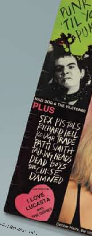
File Magazine , 1977