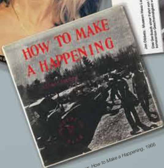
Allan Kaprow, How to Make a Happening, 1966