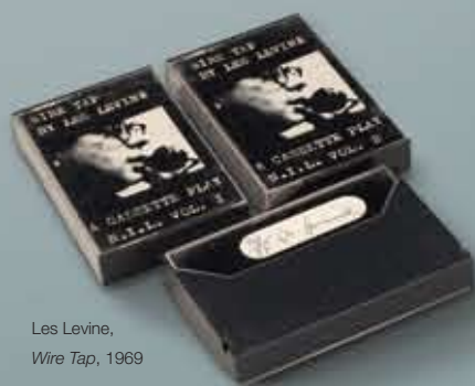
Les Levine, Wire Tap, 1969