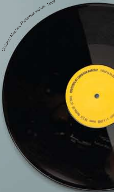
Christian Marclay, Footsteps (détail), 1989

Cinquante ans plus tard, les questions et les intérêts à l'origine de ces œuvres sonores, dissonantes et parfois inaudibles, ont toujours une profonde résonance chez les artistes. L'analyse de la hiérarchisation et du cloisonnement des arts, la sensibilisation du public à l'acoustique du quotidien, l'appropriation et le traitement du contenu médiatique, le questionnement des conventions musicales, l'étude de l'esthétique du bruit, de l'oralité et du viscéral – voilà des considérations qui trouvent toujours un écho dans la pratique contemporaine de l'art audio.