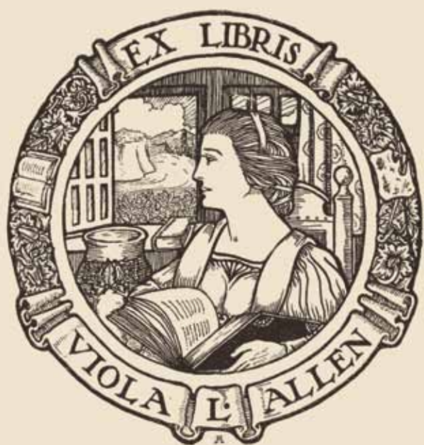
Morley Ayearst, ex-libris de Viola L. Allen, 1920 [36]

Les ex-libris, mot latin signifiant « tiré des livres (de) », sont apparus dans le sillage de l'imprimerie, au milieu du XV ème siècle. Apposés à l'intérieur des couvertures des livres pour indiquer leur appartenance, ils ont été particulièrement appréciés de la haute société au XVIII ème siècle. Au cours du XIX ème siècle, leur usage s'est répandu, attirant une classe moyenne en rapide expansion, de plus en plus susceptible de disposer de bibliothèques personnelles.