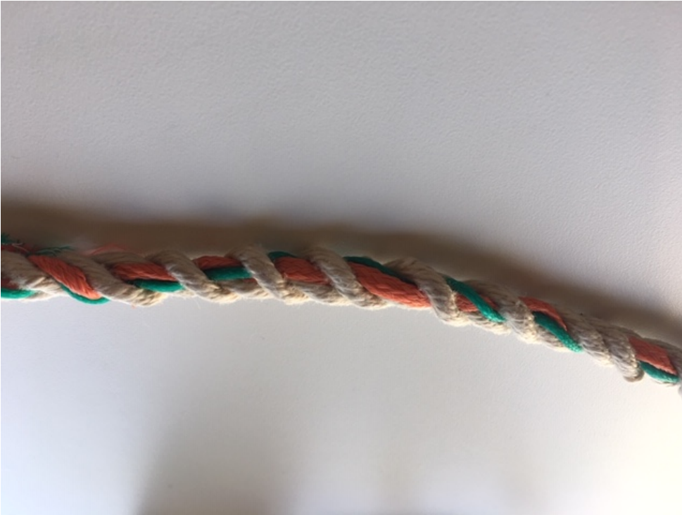
Figure B – Combinaison de couleurs identifiant la région, l'espèce et la zone de pêche La région et l'espèce entrelacés sur le même segment de corde, la zone de pêche sur le segment suivant de la corde. Cette combinaison indique la région du Québec (vert), crabe des neiges (orange), ZPC 12A (vert).

Figure A – Combinaison de couleurs identifiant une région et l'espèce Cette combinaison indique la région du Québec (vert), crabe des neiges (orange) entrelacés sur le même segment de la corde.