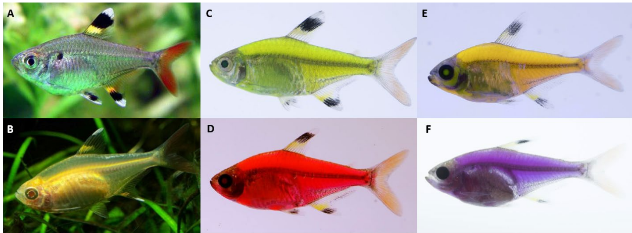
Figure 1. Quelques variantes de Pristella maxillaris . P. maxillaris domestique commun (A), P. maxillaris domestique albinos doré (B), tétra rayon-x Electric Green MD (C), tétra rayon-x Starfire Red MD (D), tétra rayon-x Sunburst Orange MD (E) et tétra rayon-x Galactic Purple MD (F).