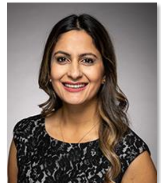
L'honorable Kamal Khera M.P. Ministre de la Diversité, de l'Inclusion et des Personnes en situation de handicap

Tout récemment, j'ai accueilli le troisième Congrès canadien sur l'inclusion des personnes en situation de handicap 49 . Cet événement a mis en lumière les efforts