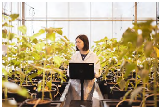
Figure [2] : Integrated Marketplace d'Innovate BC

Le 26 octobre 2023, le ministre Sajjan a annoncé que, dans le cadre du programme CPE, un financement de 3,6 millions de dollars serait accordé à Lucent Bio pour l'aider à accroître sa capacité de commercialisation et à optimiser ses processus de fabrication. Cette entreprise innovante basée en Colombie-Britannique est pionnière en matière de solutions agricoles durables et respectueuses du climat. Grâce à ce financement, l'entreprise prévoit créer 27 nouveaux emplois et porter son chiffre d'affaires annuel à 30 millions de dollars d'ici à 2026.