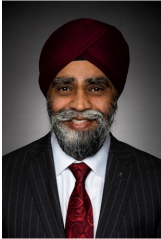
L'honorable Harjit S. Sajjan, C.P., OMM, MSM, CD, député Président du Conseil privé du Roi pour le Canada, ministre de la Protection civile et ministre responsable de l'Agence de développement économique du Pacifique Canada

J'ai le plaisir de vous présenter le plan ministériel 2024-2025 de Développement économique Canada pour le Pacifique (PacifiCan).