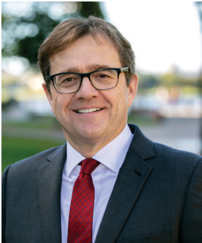
L'honorable Jonathan Wilkinson Ministre de l'Environnement et du Changement climatique

En tant que ministre responsable de Parcs Canada, je suis très heureux de présenter ma réponse à la Table ronde du ministre 2020.