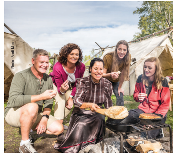
Lieu historique national Rocky Mountain House

Les participants ont fait remarquer que l'atteinte des objectifs nationaux en matière de biodiversité et le maintien des acquis en matière de conservation dans tout le Canada nécessiteront de nouveaux investissements ainsi qu'un financement continu.