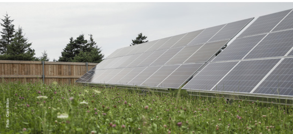
Parc national des Hautes-Terres-du-Cap-Breton

Enfin, les participants à la Table ronde du ministre ont encouragé Parcs Canada à communiquer avec un plus grand nombre d’alliés potentiels — y compris les communautés autochtones, les municipalités, les universitaires et les entreprises — afin de réduire son empreinte écologique plus rapidement et de se rapprocher d’un avenir carboneutre.