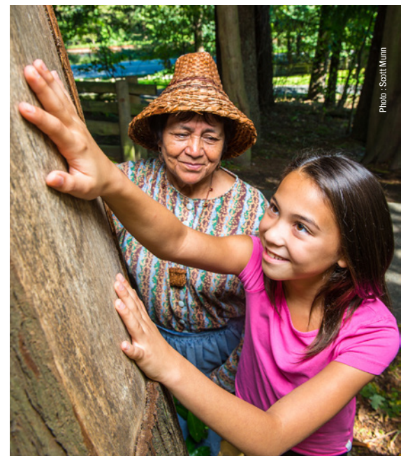
Lieu historique national du Fort-Langley

(Tiré de We Rise Together, Cercle d'experts autochtones 2018)