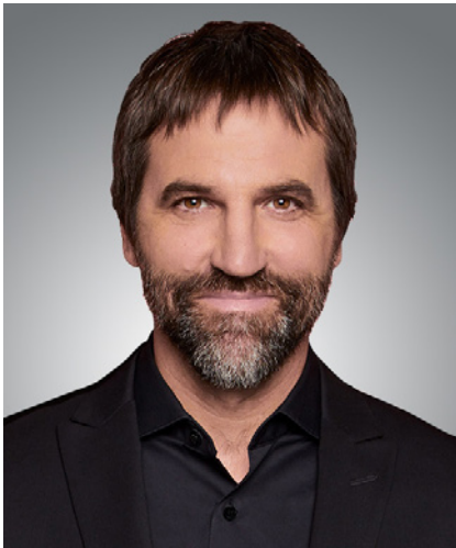
L'honorable Steven Guilbeault Ministre de l'Environnement et du Changement climatique

J'ai l'honneur d'être le ministre canadien responsable de Parcs Canada, et je suis ravi de vous faire part de notre réponse à la Table ronde du ministre 2023.