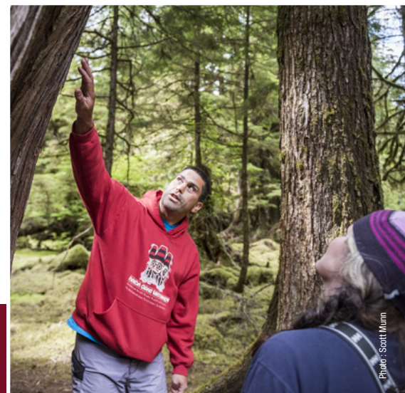
Réserve d'aire marine nationale de conservation et site du patrimoine haïda Gwaii Haanas

« Nous devons avoir recours à de multiples ressources pour définir et protéger des aires d'importance écologique et créer des liens entre elles. Il nous faudra aussi faire appel aux connaissances historiques et contemporaines des personnes vivant sur les terres et les eaux. En collaborant avec des partenaires locaux pour conjuguer les connaissances scientifiques conventionnelles, locales et autochtones, on pourra approfondir la compréhension globale de l'utilisation historique, des changements survenus au fil du temps, des facteurs de perturbation connus et anticipés, ainsi que des zones ou des populations prioritaires. »