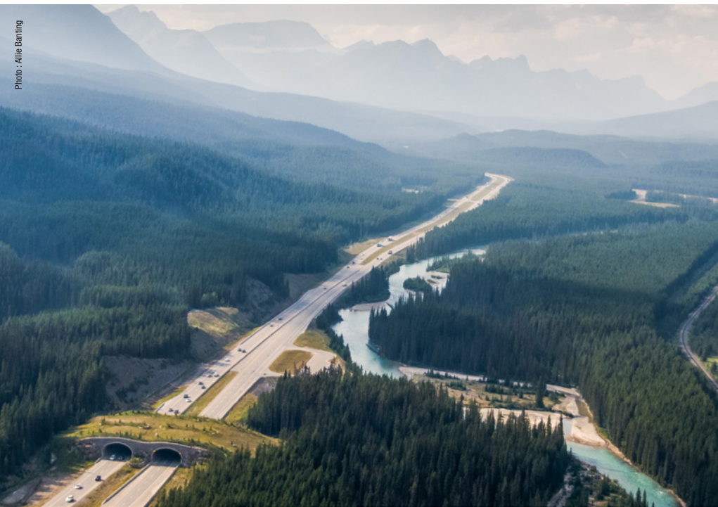
Parc national Banff

La Table ronde du ministre 2023 a eu lieu immédiatement après l'historique 15e Conférence des parties à la Convention des Nations Unies sur la diversité biologique (connue sous le nom de COP15) tenue à Montréal, et juste avant le 5e Congrès international sur les aires marines protégées (IMPAC5) qui a eu lieu à Vancouver. Ces événements ont attiré l'attention sur la nécessité impérieuse d'aborder le changement climatique et la perte de biodiversité sous un angle nouveau, tant au niveau national que mondial. La connectivité écologique, la conservation menée par les Autochtones, les parcs urbains, la conservation marine et les espaces verts ont été au cœur des préoccupations de nombreux participants à la Table ronde du ministre. La COP15 et IMPAC5 ont également souligné l'importance de l'éducation et de la promotion des liens avec le lieu comme moyen de galvaniser un plus grand soutien pour les importants travaux à venir. Les participants ont estimé que Parcs Canada pouvait éclairer le débat et faire figure de chef de file