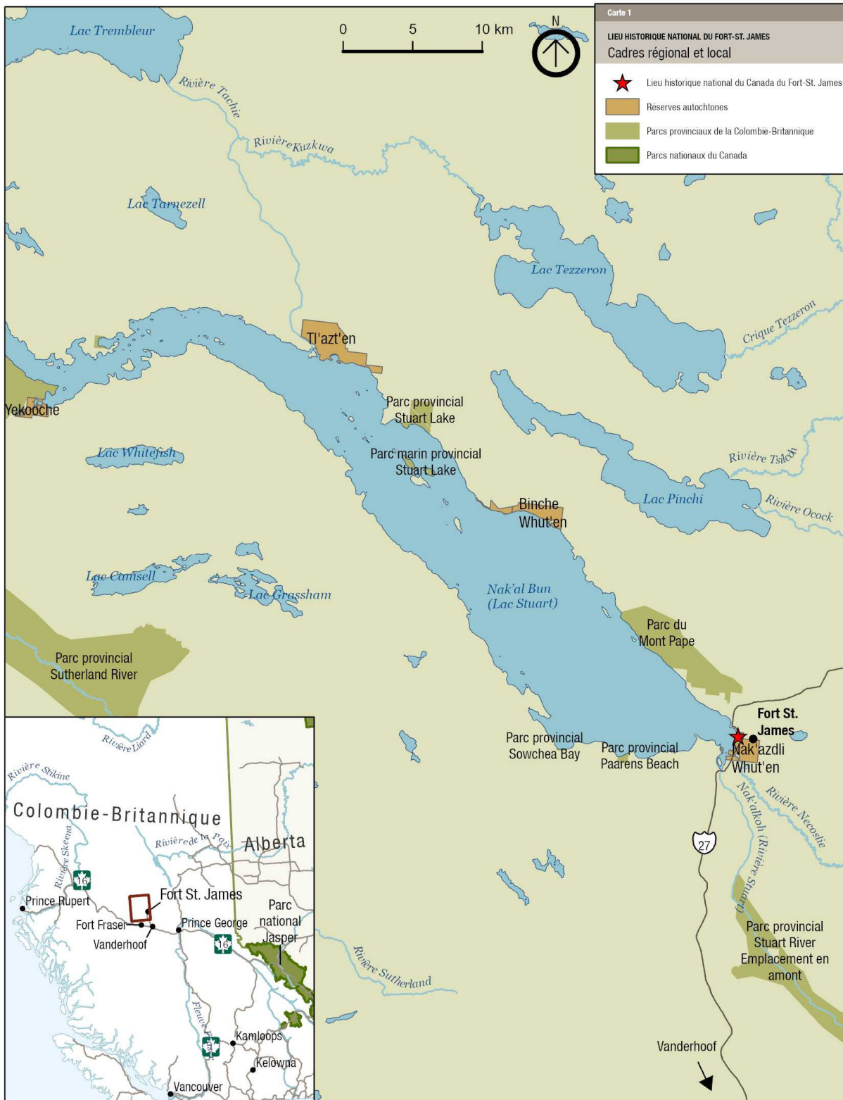
Carte 1 : Cadres régional et local