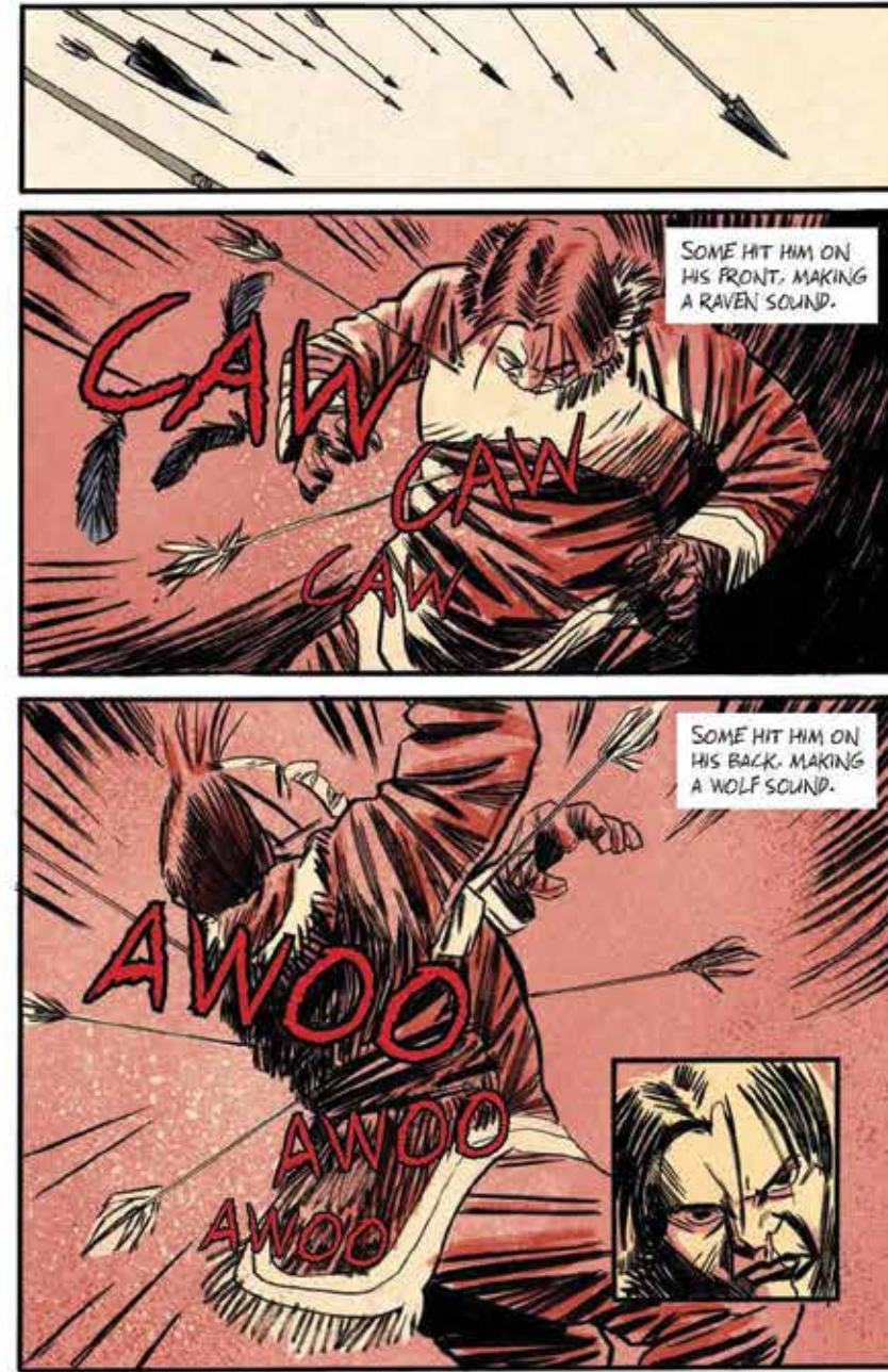
Ahiahia l'orphelin, par Levi Illuitok, Illustré par Nate Wells Publié par Inhabit Media, 2022