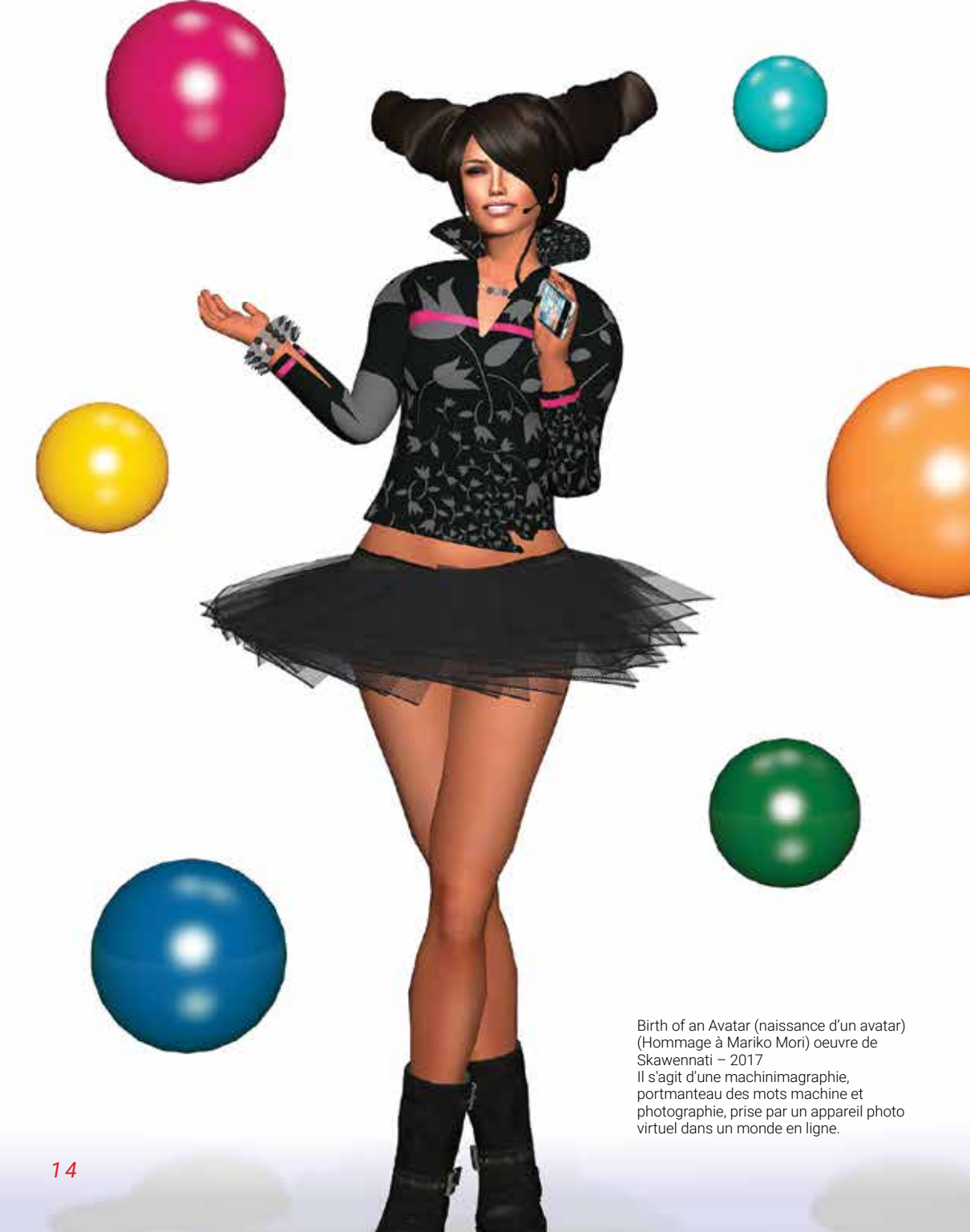
Birth of an Avatar (naissance d'un avatar) (Hommage à Mariko Mori) oeuvre de Skawennati - 2017 Il s'agit d'une machinimagraphie, portmanteau des mots machine et photographie, prise par un appareil photo virtuel dans un monde en ligne.