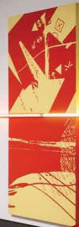
Jason Baerg, Tawáskweyáw ᑕᓴᓐᓴᓐ / A Path or Gap Among the Trees (Un chemin ou une brèche parmi les arbres), vue de l'installation à Cambridge Art Galleries, Queen's Square, 2019