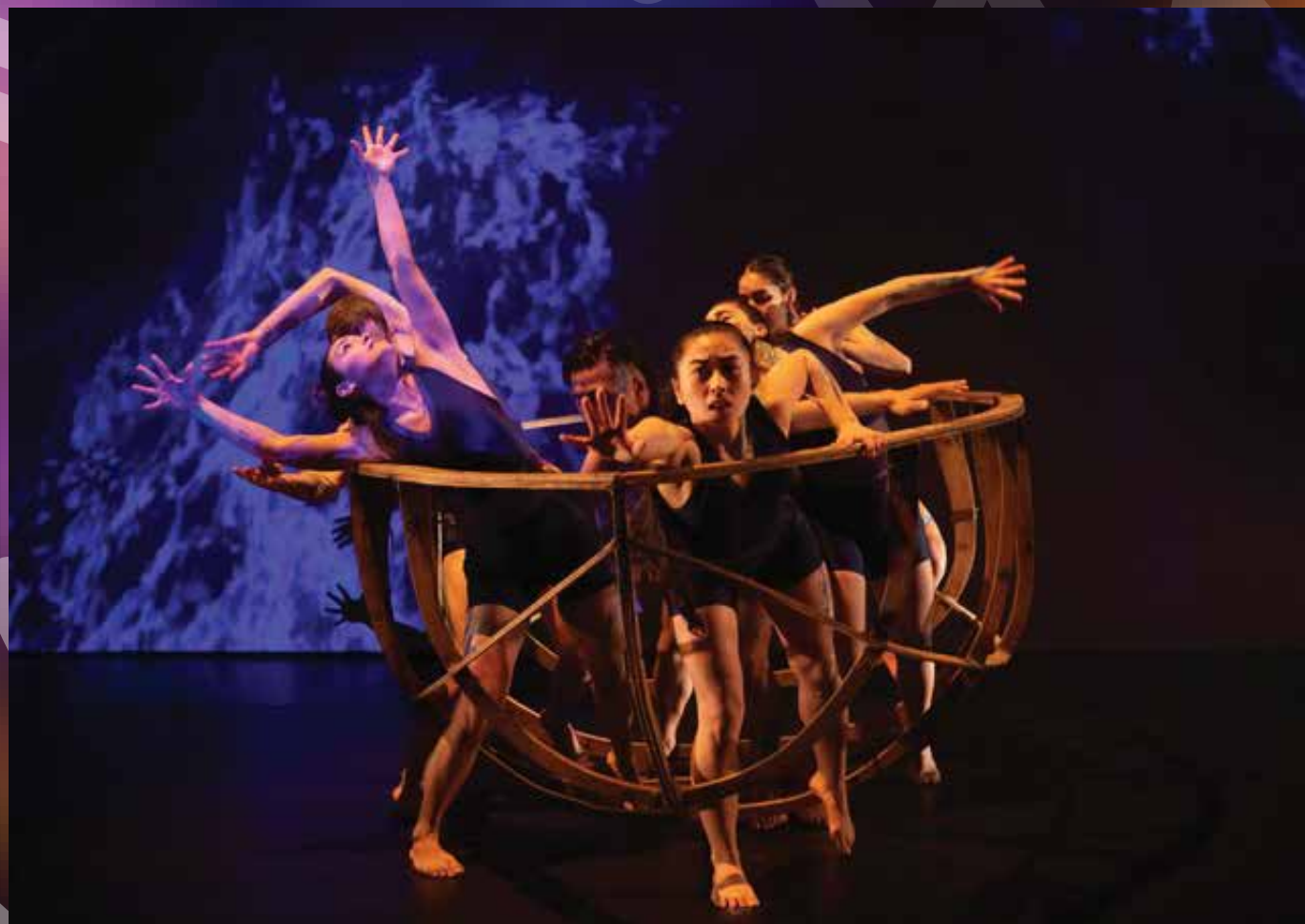
Miigis : Panthère sous-marin, Red Sky Performance Dirigé et chorégraphié par Sandra Laronde