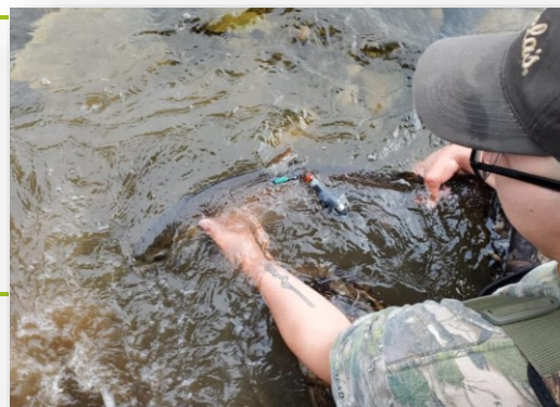
Membre de l'équipe tenant un saumon marqué dans le courant après un temps de récupération après les procédures d'anesthésie et de marquage.

Parmi les espèces de poissons que l'on retrouve dans le Canada atlantique, le saumon de l'Atlantique possède l'un des cycles biologiques et migratoires des plus complexes. Après la ponte, les saumons adultes et juvéniles (saumoneaux) quittent leur rivière natale et migrent vers l'océan Atlantique pour se nourrir, parfois même jusqu'à la mer du Labrador. Ce projet utilisera la télémétrie acoustique et satellitaire pour mieux comprendre le comportement migratoire (emplacement et utilisation de l'habitat) du saumon en mer. L'objectif de ce projet est de déterminer quand, où et pendant combien de temps le saumon de l'Atlantique à différents stades de vie (saumoneau jusqu'à l'âge adulte) se trouve dans les régions extracôtières de l'est du Canada. Les résultats appuieront la prise de décisions réglementaires dans les domaines d'activité pétrolière et gazière extracôtières du Canada.