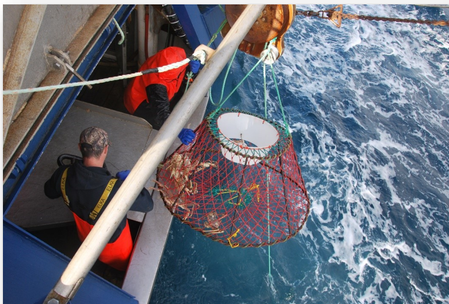
Évaluation des taux de capture du crabe des neiges avant, pendant et après les relevés sismiques.

Lancé en 1983 en vertu de la Loi sur le pétrole et le gaz du Canada (LPGC), le FEE obtient maintenant son mandat de la loi qui a remplacé la LPGC, la Loi fédérale sur les hydrocarbures (LFH), promulguée en février 1987. Également, la loi de mise en œuvre de l'Accord atlantique Canada-Terre-Neuve-et-Labrador et la loi de mise en œuvre de l'Accord Canada-Nouvelle-Écosse sur les hydrocarbures extracôtiers contribue à l'orientation législative dans les régions méridionales du Fonds.