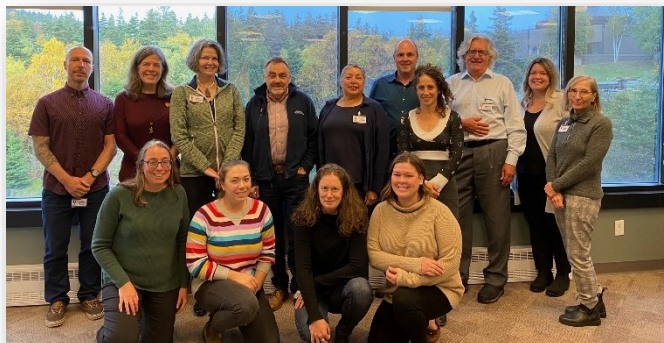
Membres du Conseil de gestion du FEE (Octobre 2022) annuel | 3

Elizabeth Young Office Canada-Terre-Neuve et Labrador des hydrocarbures extracôtiers