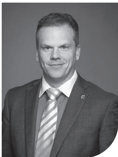
L'honorable Mark Holland Ministre de la Santé

Faire en sorte que les personnes au Canada puissent obtenir les produits de santé dont ils ont besoin, quand ils en ont besoin, est une priorité absolue de notre gouvernement.