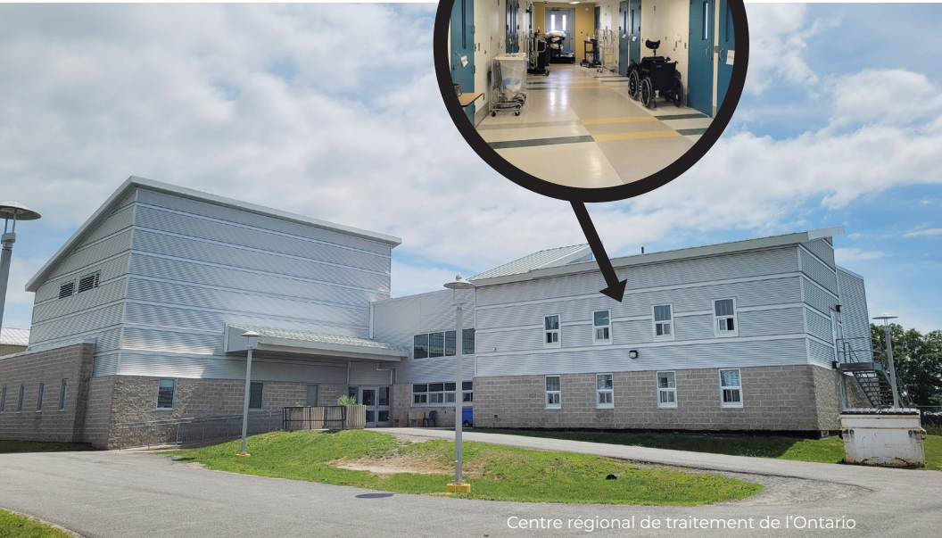
Centre régional de traitement de l'Ontario

Les centres de traitement sont des établissements à niveaux de sécurité multiples qui fonctionnent comme des établissements psychiatriques agréés. Il y en a un dans chacune des cinq régions du SCC. Ils accueillent les délinquants(es) ayant besoin de services spécialisés en raison de troubles de santé mentale, d'un déficit cognitif et/ou d'un handicap physique, ou qui ont besoin d'évaluations spécialisées.