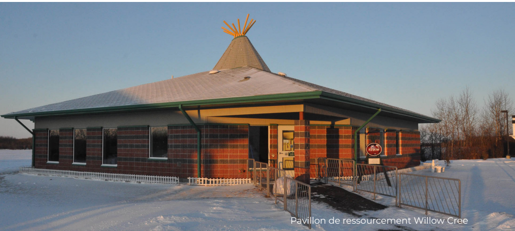
Pavillon de ressourcement Willow Cree

Les pavillons de ressourcement sont des installations axées sur les Autochtones conçues spécialement pour les délinquants(es) qui suivent un cheminement autochtone. Ils offrent des services et des programmes adaptés sur le plan culturel, fondés sur des valeurs, des traditions et des croyances autochtones, et axés sur la guérison et le lien avec la culture et les cérémonies autochtones. Les pavillons de ressourcement offrent aux délinquants(es) un environnement holistique qui les aide à se pencher sur les facteurs qui les ont menés(es) à leur incarcération. Ils les préparent à leur réinsertion sociale grâce aux liens avec la nature, à la participation à des cérémonies culturelles, aux enseignements spirituels, aux conseils spirituels de la part des Aînés et au maintien de liens avec la famille et les collectivités.