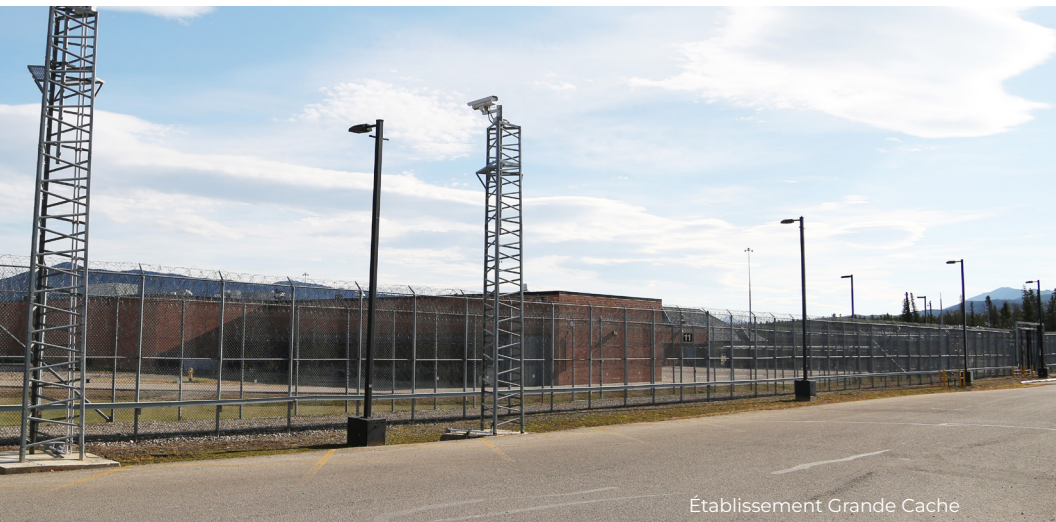
Établissement Grande Cache

Les établissements à sécurité moyenne pour hommes ont des paramètres de sécurité semblables aux établissements à sécurité maximale. Bien que certains délinquants continuent de poser un risque élevé à modéré pour la sécurité du public, ils présentent généralement un plus faible risque d'évasion et ils ont démontré qu'ils peuvent interagir efficacement avec les autres. Les délinquants peuvent être gérés en imposant moins de restrictions à leurs déplacements, leurs interactions et leurs activités au quotidien, et nécessitent un degré moyen de surveillance et de contrôle au sein des établissements.