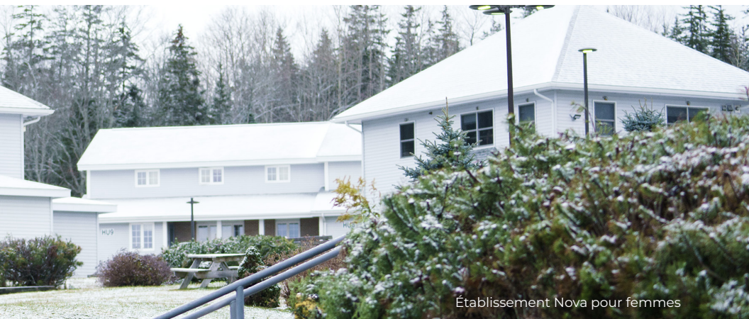
Établissement Nova pour femmes

les autres membres du personnel ajustent leur comportement en fonction de la capacité d'adaptation des délinquantes et leur permettent de gérer leurs symptômes traumatiques pour qu'elles puissent tirer profit de ces services.