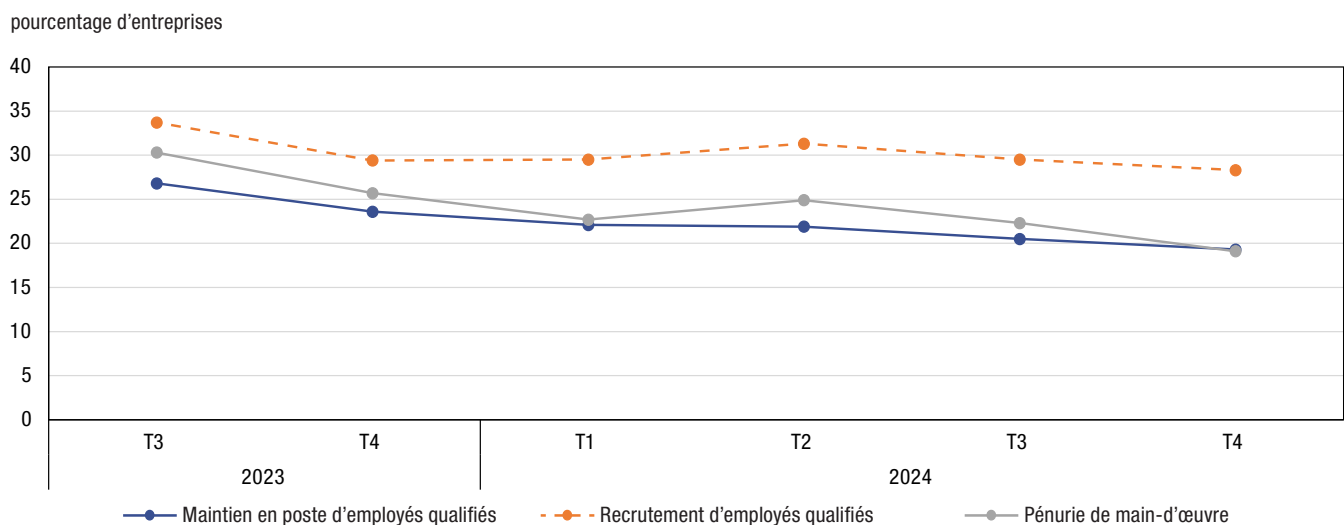
Graphique 1 Entreprises s'attendant à des obstacles liés à la main-d'œuvre au cours des trois prochains mois, quatrième trimestre de 2023 au quatrième trimestre de 2024

Note : Chaque trimestre on a demandé aux répondants d'indiquer les obstacles qu'ils s'attendaient à devoir faire face au cours des trois prochains mois. La période de trois mois peut varier selon la date pendant laquelle l'entreprise a répondu à l'enquête.