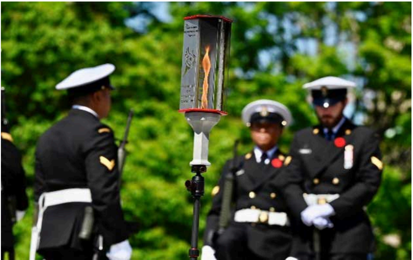
Le flambeau canadien du Souvenir entouré de sentinelles au Monument commémoratif de guerre du Canada à Ottawa.