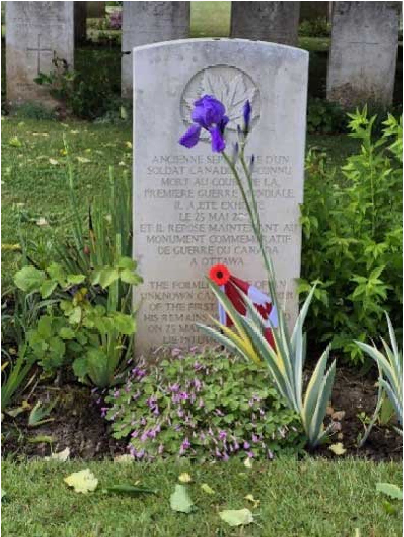
La stèle funéraire du Soldat inconnu au cimetière britannique de Cabaret-Rouge, en France.