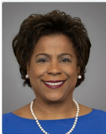
L'honorable Marjorie Michel, C.P., députée Ministre de la Santé

En tant que ministre responsable de l'ACIA, je suis heureuse de présenter le plan ministériel de l'ACIA pour 2026 à 2027.