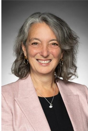
L'honorable Julie Dabrusin, C.P., députée Ministre de l'Environnement et du Changement climatique et ministre responsable de l'Agence d'évaluation d'impact du Canada