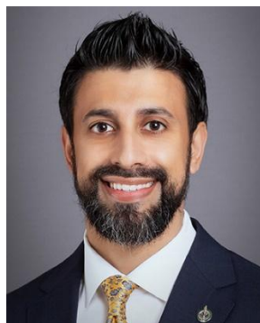
L'honourable Maninder Sidhu Ministre du Commerce international