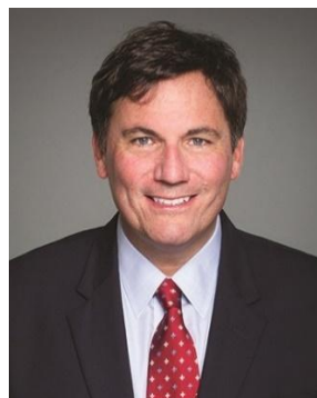
L'honourable Dominic LeBlanc Président du Conseil privé du Roi pour le Canada et ministre responsable du Commerce Canada– États-Unis, des Affaires intergouvernement ales et de l'Unité de l'économie canadienne