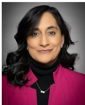
L'honourable Anita Anand Ministre des Affaires étrangères