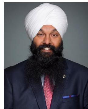
L'honourable Randeep Sarai Secrétaire d'État (Développement international)

Au cours de la prochaine année, Affaires mondiales Canada travaillera avec des partenaires canadiens et internationaux pour protéger et promouvoir les intérêts du Canada dans un monde de plus en plus complexe.