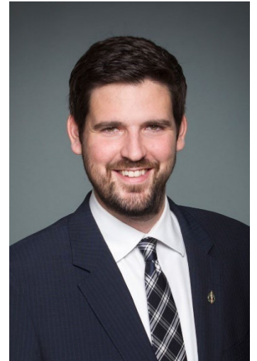
L'honorable Sean Fraser, C.P., c.r., député

Parallèlement, le gouvernement fédéral garantit que ses dépenses sont stratégiques, responsables et efficaces. Les points de service de l'APECA demeurent ouverts dans toute la région, les investissements continuent à soutenir la croissance, l'innovation et les possibilités, et les entreprises et collectivités peuvent compter sur le soutien dont elles ont besoin.