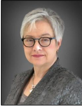
Manon Brassard Présidente et première dirigeante

J'ai le plaisir de présenter le Plan ministériel de la Commission de l'immigration et du statut de réfugié du Canada pour 2026 à 2027 . La Commission de l'immigration et du statut de réfugié du Canada (la CISR ou la Commission) est le plus grand tribunal administratif du Canada.