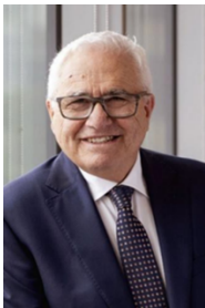
Raymond Thériault, Commissaire aux langues officielles

Une chose est certaine, en 2026-2027, le Commissariat continuera de mettre son expertise à profit en collaborant avec les institutions fédérales, les communautés de langue officielle en situation minoritaire et les autres parties prenantes. Mon équipe et moi sommes déterminés à jouer un rôle de premier plan afin que l'égalité du français et de l'anglais demeure une valeur fondamentale partagée par l'ensemble de la société canadienne et une priorité sur l'échiquier national.