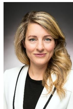
L'honorable Mélanie Joly, ministre de l'Industrie et ministre responsable de Développement économique Canada pour les régions du Québec

DEC continuera aussi de miser sur une économie inclusive en appuyant des entreprises dirigées par des personnes issues de groupes sous-représentés et en soutenant des projets ayant un impact positif sur l'ensemble de la population, incluant les communautés autochtones.