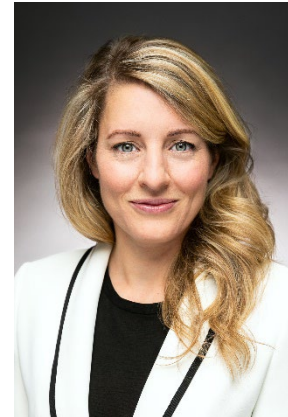
L'honorable Mélanie Joly Ministre de l'Industrie et ministre responsable de Développement économique Canada pour les régions du Québec

Nous prendrons aussi part aux missions gouvernementales afin de renforcer la base industrielle canadienne, de favoriser l'intégration des PME québécoises dans les chaînes d'approvisionnement stratégiques et de positionner avantageusement le Canada dans les secteurs d'avenir.