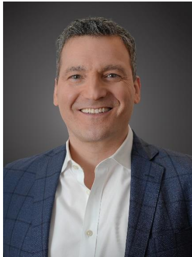
L'honorable Evan Solomon

Ministre de l'Intelligence artificielle et de l'Innovation numérique et ministre responsable de l'Agence fédérale de développement économique pour le Sud de l'Ontario