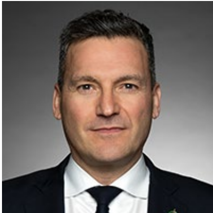
L'honorable Evan Solomon

Ministre de l'Intelligence artificielle et de l'Innovation numérique et ministre responsable de l'Agence fédérale de développement économique pour le Sud de l'Ontario