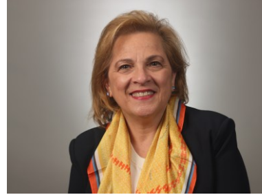
L'hon. Lena Metlege Diab, C.E.N.E., C.R., C.P., députée

En tant que ministre de l'Immigration, des Réfugiés et de la Citoyenneté, je suis heureuse de présenter le Plan ministériel de 2026-2027. Ce plan décrit les prochaines étapes que nous allons suivre pour rétablir le contrôle de notre système d'immigration, ramener l'immigration à des niveaux viables et l'aligner sur la capacité de croissance du Canada.