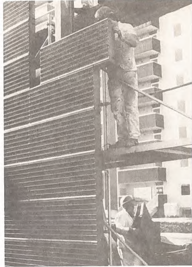
Noise Protection Barriers Barrières antibruit