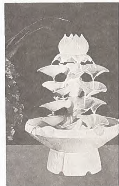
Decorative Water Fountains Fontaines décoratives