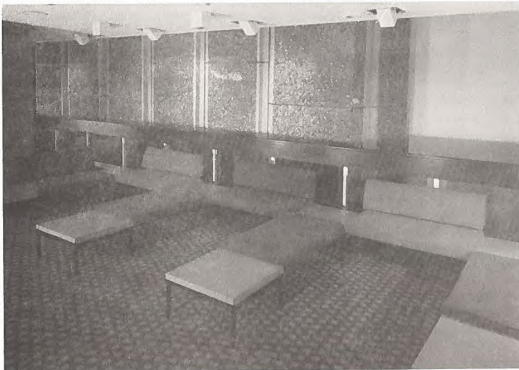
Interlocking Tables and Chairs Tables et chaises enclenchables