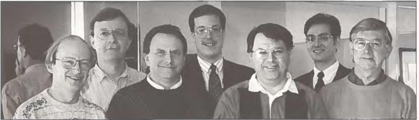
Les membres du groupe de travail ministériel.

Les normes portent sur les domaines suivants : planification de la gestion de l'information; mise au point des systèmes et entretien; mise au point des applications et entretien; gestion de données; logiciels; matériel; télécommunications; sécurité; gestion de texte; graphiques. ▲