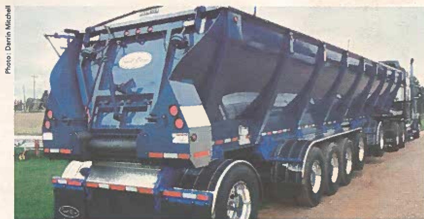
Remorque à fond mobile Trout River de 48 pi à 5 essieu.

Les utilisateurs des remorques de Trout River n'ont cessé de souligner la rapidité avec laquelle ils déchargent leur marchandise par le biais d'un appareillage de chaînes/ceintures