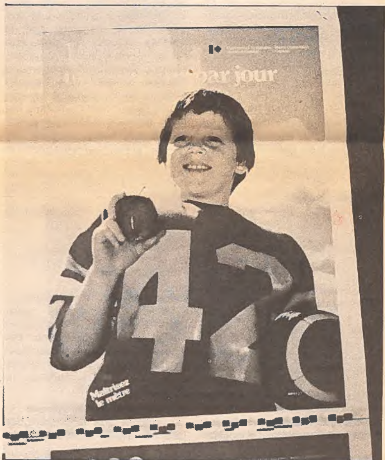
Pour obtenir un exemplaire de l'affiche ci-dessus veuillez écrire à la Commission du système métrique Canada, Boîte 4000, Ottawa K1S 5G8.