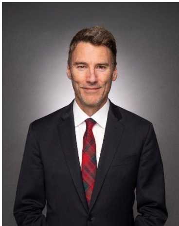
L'honorable Gregor Robertson Ministre du Logement et de l'Infrastructure et ministre responsable de Développement économique Canada pour le Pacifique

Le Plan ministériel 2026-2027 constitue la feuille de route de LICC pour passer de l'ambition à l'action et bâtir des collectivités fortes aujourd'hui et pour l'avenir. Je vous invite à lire ce plan pour en apprendre davantage sur les politiques et les programmes de LICC qui visent à rendre les logements plus abordables, à bâtir des infrastructures pour les générations à venir et à aider les Canadiens à améliorer leur sort.