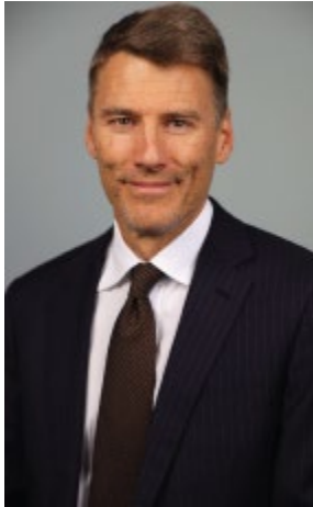
L'honorable Gregor Robertson Ministre du Logement et de l'Infrastructure et ministre responsable de Développement économique Canada pour le Pacifique

Les infrastructures constituent le fondement de la qualité de vie des Canadiens, de la croissance économique de notre pays et de la résilience de nos collectivités. Je suis fier du travail et des résultats réalisés par le Ministère au cours de la dernière année pour les Canadiens, et je vous invite à lire ces pages. Il reste toujours du travail à faire, et j'ai hâte de faire progresser notre mandat au cours de la prochaine année. Nous continuerons à travailler en étroite collaboration avec nos partenaires pour bâtir un marché du logement qui convient à tous, faire croître notre économie et créer des collectivités résilientes qui prospéreront pendant de nombreuses générations.