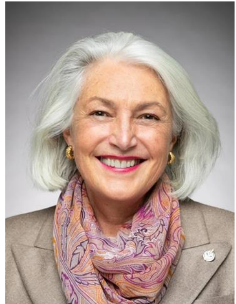
L'honorable Joanne Thompson, C.P., députée Ministre des Pêches

Le Ministère continuera également à soutenir la Décennie des Nations Unies pour les sciences océaniques au service du développement durable, ainsi qu'à travailler en étroite collaboration avec la communauté océanographique et d'autres partenaires, tant sur le plan national qu'international, pour faire progresser la science et approfondir les connaissances nécessaires visant à soutenir des politiques et des décisions fondées sur des données probantes.