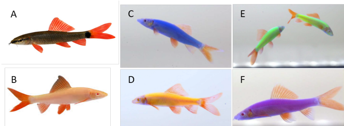
Figure 1. Les variantes transgéniques fluorescentes GloFish MD E. frenatum visées par le présent avis. E. frenatum domestique non transgénique (A), E. frenatum albinos non transgénique (B), labéo fenatus GloFish MD Cosmic Blue MD (C), labéo fenatus GloFish MD Sunburst Orange MD (D), labéo fenatus GloFish MD Electric Green MD (E), et labéo fenatus GloFish MD Galactic Purple MD (F). Toutes les images ont été fournies par Spectrum Brands et prises sous lumière bleue, à l'exception de A, qui provient de Pets on Mom , et de B, qui provient de Navya Aquarium.

Bien que plus de détails sur la structure, l'élaboration et la fonction des constructions transgéniques utilisées pour créer les labéos GloFish MD aient été fournis par l'entreprise à des fins d'examen, ces renseignements sont considérés comme des renseignements commerciaux confidentiels et ne sont pas inclus dans le présent document.