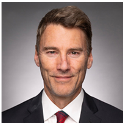
L'honorable Gregor Robertson

Je vous invite à poursuivre votre lecture pour voir comment PacifiCan investit dans la croissance économique pour les Britanno-Colombiens et l'ensemble de la population canadienne.