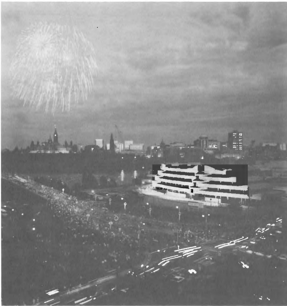
Le nouvel édifice du Musée canadien des civilisations en voie de construction et le pont Alexandra. Photo prise le 1 er juillet 1986, jour de la Fête du Canada.

Après de nombreuses et fastidieuses réunions de comités, une multitude de rapports rédigés à la hâte, et quelques prétendues périodes d'accalmie au milieu des activités, les travaux sont maintenant presque terminés. Les architectes ont déployé une imagination grandiose et ont imposé des contraintes quant à l'élaboration du concept, comme ils se devaient de le faire. Les milieux de la conservation, entre autres, ont réagi avec vigueur à tous les stades de l'élaboration du projet, par l'intermédiaire des divisions de la restauration des musées concernés, de l'ICC et des restaurateurs de l'ensemble du Canada qui s'intéressaient à ces projets. On peut discuter à perpétuité des mille et une imperfections de ces nouveaux édifices, mais ceux-ci, tout compte fait, abriteront d'une manière adéquate notre patrimoine national. •