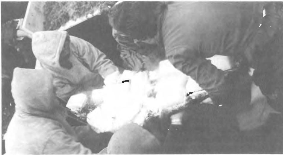
Squelette détérioré en train d'être soulevé. Photo prise à Red Bay, Labrador. Le squelette et la terre qui l'entoure ont été congelés avec de la glace sèche.

sur le plan de l'éthique professionnelle et, d'autre part, permettent à l'archéologue d'atteindre ses objectifs. Le réenfouissement de grandes quantités de matériel constitue une solution tout à fait acceptable lorsque la seule autre alternative serait d'entreposer ce matériel dans des conditions qui auraient pour résultat sa destruction ou l'encombrement des réserves, par suite de l'accumulation de millions de fragments qui ne pourraient servir à des analyses. On a eu recours à ce mode d'action dans le cas de plusieurs navires naufragés et, en fait, certains archéologues choisissent cette solution lorsqu'ils doivent décider ce qu'il convient de faire avec de grandes quantités de tessons ou pièces en céramique.