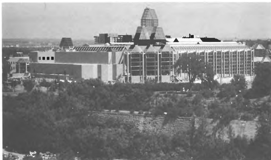
Le nouvel édifice du Musée des beaux-arts du Canada, vu de l'arrière de la Bibliothèque du Parlement de la Chambre des communes, sur la Colline parlementaire.

Mais au delà des strictes préoccupations que l'on pouvait avoir au sujet de la conservation, il fallait se soucier des questions de