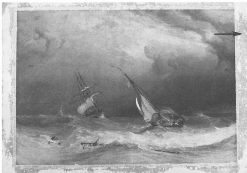
Taches d'adhésif laissées par la partie antérieure du passe-partout après son enlèvement ('Off the Eddystone', A.V.D. Copley Fielding)