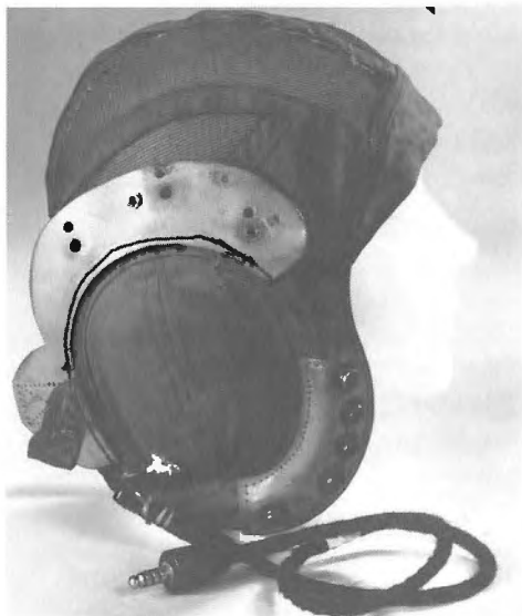
Casque d'aviateur des années 1950.

L'orientation ultérieure de l'étude dépendra dans une large mesure des résultats obtenus au cours de la première étape. Il est probable, toutefois, que nous examinerons de plus près l'influence que peut avoir la concentration du composé de magnésium sur les effets observés. La priorité sera accordée à l'étude des fibres qui se seront avérées sensibles aux sels alcalins pendant les expériences de la phase I. Nous envisageons également d'entreprendre des études similaires sur des procédés de désacidification non aqueux. •