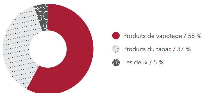
Figure 2. Pourcentage de plaintes par type de produit au cours de l'exercice 2024–2025

Les demandes de renseignements et les plaintes reçues constituent une source de données permettant au ministère de comprendre ce que la population canadienne observe et quelles sont ses préoccupations. Les demandes et les plaintes qui concernent une non-conformité potentielle peuvent déclencher une inspection.