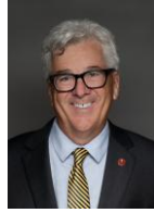
L'honorable Colin Deacon Vice-président