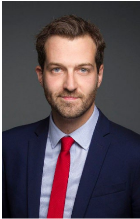
L'honorable Joël Lightbound, C.P., député

Ministre de la Transformation du gouvernement, des Travaux publics et de l'Approvisionnement et lieutenant du Québec